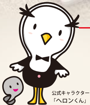
公式キャラクター 「ヘロンくん」